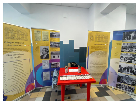
2. Standul Colegiului Național „Ion Neculce” la Târgul de oferte educaționale 2021-2022 organizat de Consiliul elevilor