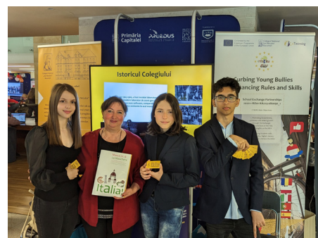
3. Standul Colegiului Național „Ion Neculce” la Târgul de oferte educaționale 2022-2023 organizat de PROEDUS la Biblioteca Națională