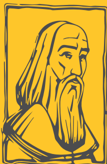
Colegiul Național „Ion Neculce” București